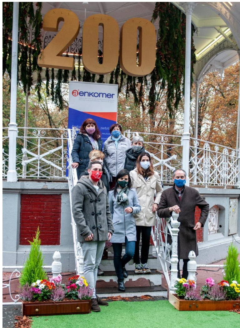
Kiosko del Parque de La Florida

Apaindutako monumentu hauek gure hirian bisitatu ahal izango dira azaroaren 2ra arte. Jarduera honen bidez, gure hiriko gune enblematiko bat gogoratu nahi da, La Florida Parkea, hain zuzen ere, sektoreko profesionalen gaitasuna eta proiektu komunetan batzeko eta beren jarduera hiriko ekitaldiekin lotzeko gaitasuna erakutsiz.