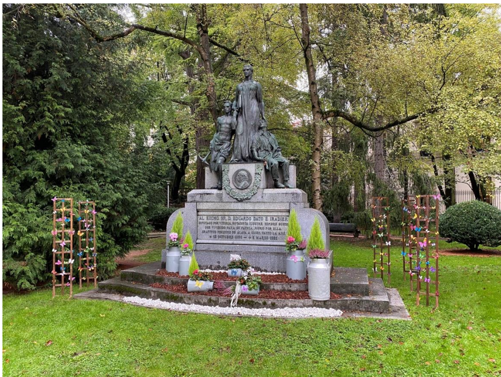
Monumento de Eduardo Dato