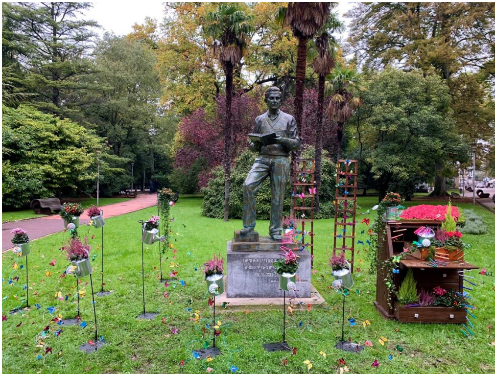
Escultura de Ignacio Aldecoa