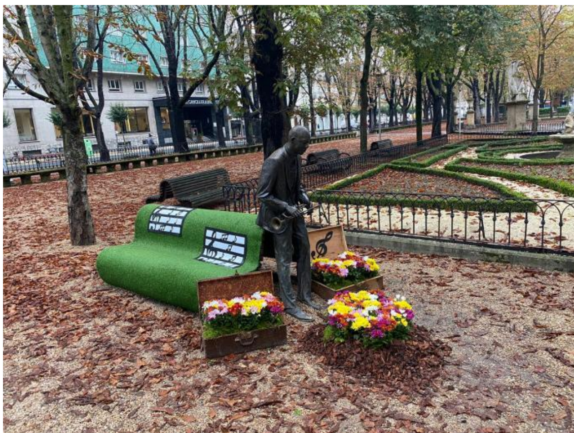
Escultura dedicada al Jazz